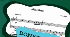
DONNE, ANIMA E FUTURO